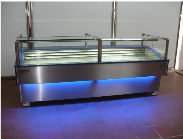
Möglichkeit 1 Bedienungstheke